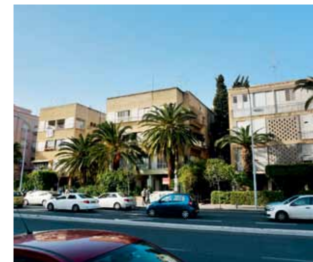
Patrick Geddes deed geen uitspraken over de architectuur. Bauhaus-architecten – voornamelijk Joden die in de jaren dertig uit Duitsland waren gevlucht – ontwierpen gebouwen van vier verdiepingen op 'poten'.