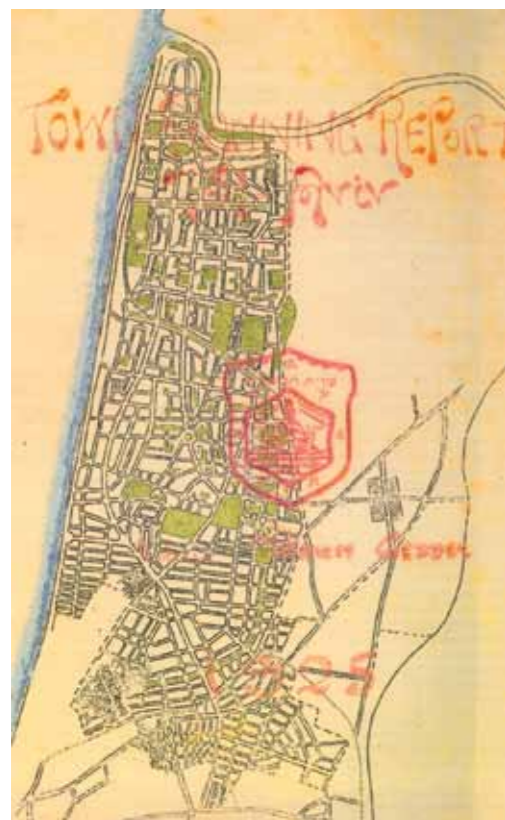
Het ontwerp van de Schot Patrick Geddes voor de Witte Stad: een grillig wegenpatroon met groene vlekken van parken, begraafplaatsen, restanten van oevers en sinaasappelplantages. In zijn toelichting stelt Geddes dat het groene karakter ook tot stand komt door buurtparkjes en kavels die maar voor een derde bebouwd mogen worden.

Het stadsbestuur weet zich geen raad met het beheer van het werelderfgoed van de Witte Stad. In een recent gemeentelijk masterplan wordt de Witte Stad aangemerkt als te behouden gebied, maar daar blijft het bij. Het plan richt zich vooral op de ontwikkeling van het stedelijk gebied buiten de Witte Stad.