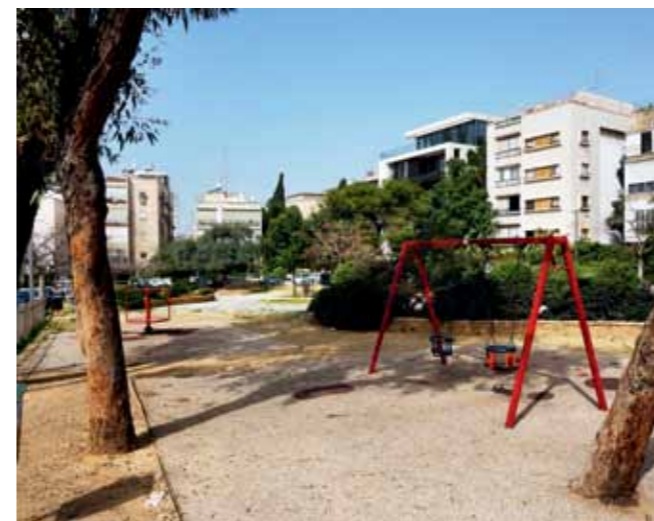
Het ideaalbeeld volgens Geddes: bouwblokken rond een openbare groene plek.