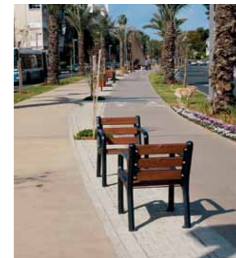
Flaneren en fietsen zijn een genot op de brede boulevards.