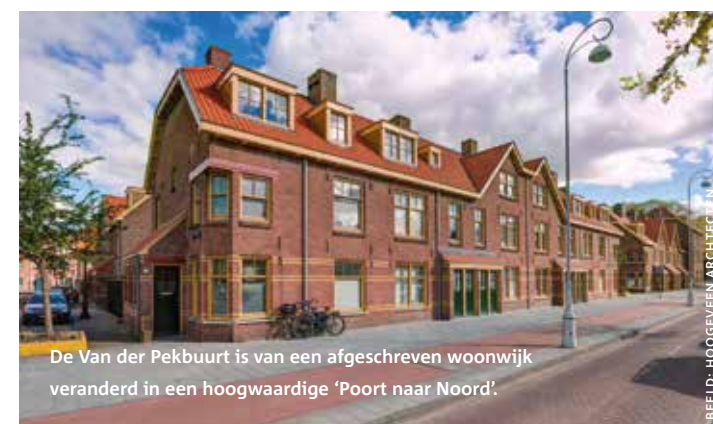
De Van der Pekbuurt is van een afgeschreven woonwijk veranderd in een hoogwaardige 'Poort naar Noord'.

Sinds de stadsvernieuwing komt het woord 'volksbuurt' niet meer voor in beleidsnota's. In plaats daarvan worden ze aangeduid als probleemwijken, aandachtswijken of achterstandswijken en varianten daarop. In het dagelijkse taalgebruik blijft de volksbuurt voortbestaan. Dan gaat het vaak over de arbeiderswijken en tuindorpen buiten het historisch stadscentrum, zoals de tuindorpen in Amsterdam-Noord. Armoede en eenzaamheid contrasteren hier met dure koffies en gehaaste bakfietsgezinnen. In Tuindorp Oostzaan vind je in de ene straat bijvoorbeeld een weggeefwinkel in een voortuin en even verderop een chique koffiezaak. In de Van der Pekbuurt, waar bewoners stredden tegen sloopplannen, doemen aan de randen dure appartementen op. Gentrificatie blijkt vaak de fysieke redding van de volksbuurt te zijn. Oudere bewoners die weinig te kiezen hebben, lijken er weg te kwijnen. In hoeverre blijft de volksbuurt behouden, wanneer het een gerenoveerd stedelijk decor is in plaats van een sterke leefgemeenschap?