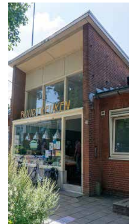
Buurtkeuken in Nieuw-West.

Is dat erg? Niet echt, lijkt het in de ogen van het ministerie van Volkshuisvesting en Ruimtelijke Ordening. De Voortgangsrapportage NPLV 2024 tot en met zomer 2025 rept met geen woord over volksbuurten. De focus ligt op het terugdringen van armoede en werkloosheid, bevorderen van gezondheid, onderwijs en veiligheid en tegengaan van criminaliteit. Om deze doelen te bereiken is bewonersbetrokkenheid nodig, alsmede allianties met maatschappelijke partners, stelt het rapport. Saamhorigheid krijgt hiermee een instrumentele inbedding, als middel om beleidsdoelen te realiseren. Dat verschilt met de historische en organisch gegroeide saamhorigheid in oude volksbuurten, die vaak bestond zonder – en soms ondanks – de overheid. Actieve overheidsbemoediging werd hier zelden op prijs gesteld. Bij deze vormen