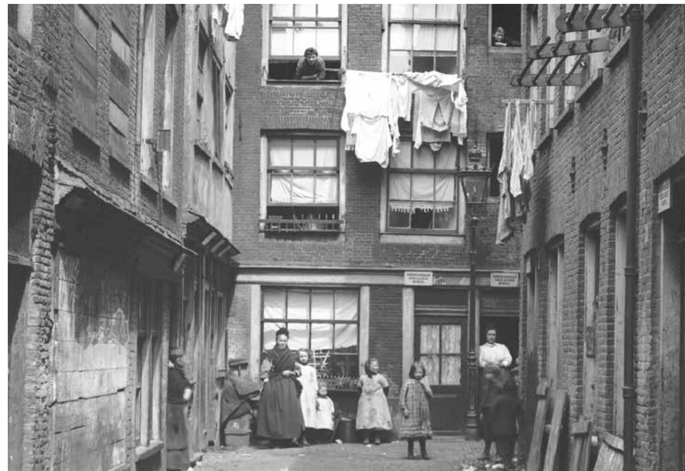
Hét beeld van een volksbuurt: De Jordaan in 1912. Blik op de Wijdegang vanuit de Willemsstraat. Onder: De Jordaan is allang geen volksbuurt meer.

Onze reis begon met de wens meer te weten te komen over de Nederlandse volksbuurt. Wat is een volksbuurt? Wanneer zijn die buurten ontstaan? Wat is er in de loop van de tijd mee gebeurd, bestaan ze nog en hoe ziet hun toekomst eruit? Die vragen vormden het startpunt van een ontdekkingstocht langs de Nederlandse volksbuurt. Het resulteerde in acht artikelen voor de website van het Volksbuurtmuseum in Utrecht, waarin vooral de ruimtelijke veranderingen centraal stonden. Daarna volgde een cursus voor het Hoger Onderwijs voor Volwassenen (hovo) in Utrecht, Rotterdam, Nijmegen en Amsterdam. Gentrificatie had daarin een prominente plek en er kwamen veel voorbeelden voorbij uit het Nationaal Programma Leefbaarheid en Veiligheid (NPLV).